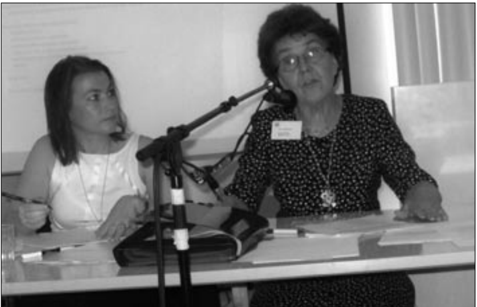
Puheenjohtaja yhteistyöseurojen kokouksessa.

Jäsenistömme noin 200-300 henkilöjäsentä ovat melko iäkkäitä. Tästä johtuen jäsenten siirtyminen tuonilmaisiin aiheuttaa vääjäämätöntä jäsenmäärän