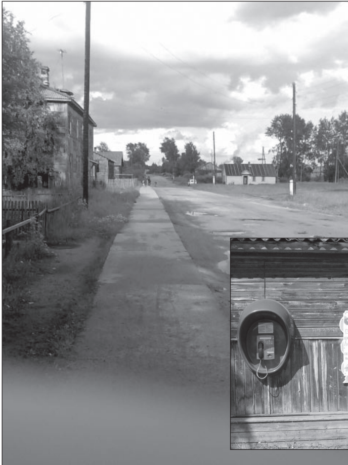
Satunnaisen turistin tehtäviin kuuluu kävely kylällä. Kuvaa alla Repolan pääraittia ja yleisöpuhelin kaupan seinällä

tapahtuma ja vierailun kohokohta. Viime vuosikymmenellä suomesta tulleilla retkeläisillä oli myös ohjelmaa ja esittäjiä mukanaan; nykyvuosina eivät resurssit ole riittäneet. Paikalliset ja Muujärveltä tulleet ryhmät esittävät erilaisia laulu-, musiikki ja tanssiohjelmia. Kylän koulun oppilaat ovat aktiivisia esittäjiä. Puheita ja runon- ja tarinankerrontaa ei ole. Seuramme on saanut myös sanoa terveiset Suomessa.