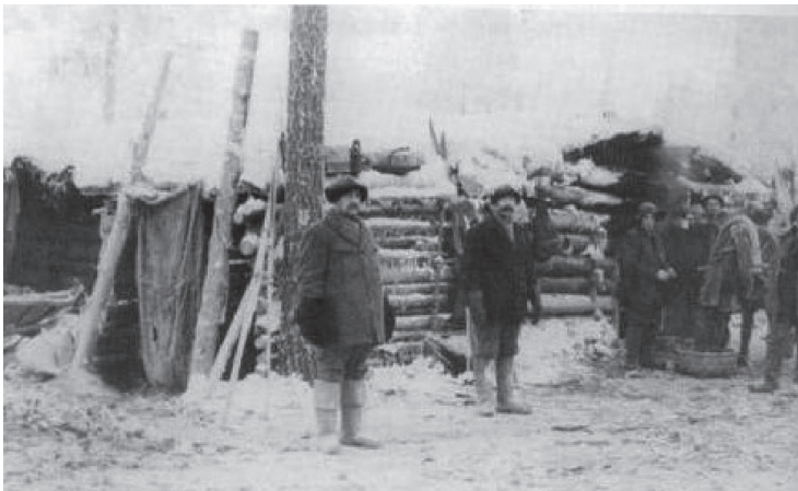
Gutzeitin hakkuilla Repolassa vuosisadan vaihteessa. Kuva Aunuksen Repola-kirjasta s.148

1900-luvun taitteessa hakkuu- ja uittotöistä tuli Repolan miesten tärkein ansiotyö, joka osin syrjäytti jopa perinteiset elinkeinot, kuten kalastuksen, metsästyksen ja laukkukaupan. Hakkuu- ja uittokausina savotat kärsivät jopa työvoimapulasta, joten satoja suomalaisia hevosmiehiä, metsätyömiehiä ja uittotyöläisiä oli hakemassa töitä Repolan laajoilta hakkuupalstoilta. Savottatyömaiden suomalaiset isännät maksoivat työntekijöilleen noin kaksi kertaa korkeamman palkan kuin venäläiset muualla Karjalassa. Metsätyömiehen päiväpalkka oli keskimäärin 1,5 ruplaa päivässä.